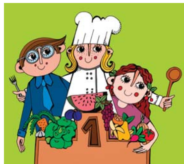
Ilustrace: Mgr. Kateřina Mrmůstíková

Od posledního vydání novin „Poctivě vyrobené“ uběhlo půl roku. V LÍSCĚ jsme poctivě pokračovali ve stejném tempu – jako máme ve zvyku. V měsíci červnu jsme ukončili dva velké projekty, „Jak učít Poly“ a „Jak funguje svět“, oba na podporu polytechnického vzdělávání v mateřských školách. Vzdělávacích akcí se zúčastnilo 192 pedagogů. Společným úsilím dvou desítek lektorů a učitelů vzniklo 7 sad pomůcek a k nim sborník 70 metodických listů na téma voda, země, vzduch, slunce, materiály, řemesla a zahrada. V červenci jsme dokončili projekt „Bezpečně a zdravě do života“ pro základní a střední školy. Projektem prošlo 160 dospělých a 504 žáků. Vydali jsme sborník textů a metodických listů „Zdravá a bezpečná škola“. Připravujeme vzdělávací akce pro pedagogy, exkurze a pobyty pro rodiny s dětmi i veřejnost, výukové programy pro školy a jubilejní XV. Krajskou konferenci o EVVO, která se koná 12. listopadu 2015 v prostorách 14115 Baťova institutu ve Zlíně na téma „Poznáváme a objevujeme přírodu“.